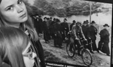
FRANCOUZANŹW Z MIEDZOLANŹW, 1939. FRENCHMEN BEING ARRIVED, 1939.