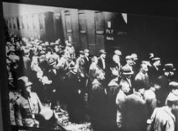
PIERWSZY TRANSPORT WIĘZNIÓW POLITYCZNYCH - 728 POLAKŹW (W TYM RELIŻ POLSKICH STWORZY PRZYTRZYDZI 90 OBOZŹW Z TAMŹWICH 1401940R. THE FIRST TRANSPORT OF 728 POLISH POLITICAL PRISONERS, AMONG WHICH THERE WERE SEVERAL POLISH JEWS, ARRIVED IN AUSCHWITZ FROM TAMŹW ON JUNE 14, 1940.