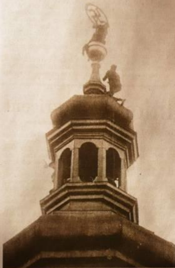
LIKVIDACE NENÁVIDĚNÉHO SYMBOLU. Tři muži sundávají 5. května 1945 hákový kříž z věže česko-budějovické radnice. Jedním z nich je budoucí manžel Blanky Klimešové.

Obtížné období začalo pro Blanku Klimešovou v roce 1941. Tehdy nacisté poslali jejího otce do vězení za roznášení profinaneckých letáků. „První měsíc byl vězněn v Budějovicích a toho jsem využívala. Vždy, když šel vězni na práci, držela jsem se podél přívodu a nenápadně sledovala tatínka. Pak sešli do sklepa rezat dříví, já se zastavila u okénka, ve kterém se za chvilku tatínka objevil, a hodila mu cigarety. Po těch strašně toužil,“ vypráví.