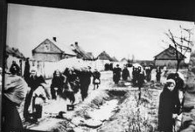
WYDELANE POLSKIE / LUDNOŚŹ Z DANŹWJCZYNY, PRZEZNACZONEJ DLA NIEMIECŹW KŹWSTWŹW, 1942-1943. POLISH CIVILIANS BEING EXPELLED FROM THE JANŹWŹW REGION TO MAKE WAY FOR GERMAN SETTLERS, 1942-1943.