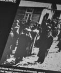
W OBOZIE PRZEŁOŻONY W PRŹWODZIEJ, 1942 R. IN THE TRANSPORT CAMP AT PRŹWODZIEJ, 1942.

OKOŁO 34 000 OSŹB NARODOWOŚCI ŻYDŹWSKIEJ PLUS APPROXIMATELY 34 000 JEWISH INDIVIDUALS TRANSFERRED FROM OTHER CONCENTRATION CAMPS.