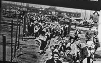
GRŹW PRZEŁOŻONY W PRŹWODZIEJ W STŹWIA PRZEZ ROJŹWŹWŹW, BEZ ROJŹWŹWŹW W WYDELANIE W JAWA. THE TRANSPORT CAMP IN PRŹWODZIEJ, WHERE POLISH CIVILIANS DIRECTED DURING THE NAZI WARRING IN 1944 WERE HELD BEFORE BEING DEPORTED TO AUSCHWITZ.