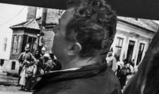
WYDELANE W JAWA. EXPELLED IN JAWA.

DACUNKOWA LICZBA ŻYDŹW, DEPORTOWANYCH DO KL AUSCHWITZ: ESTIMATED NUMBER OF JEWS DEPORTED TO AUSCHWITZ: