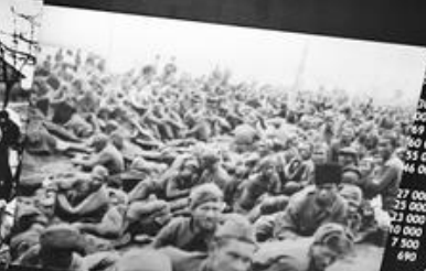
SOWIECCY JEKCY WŁEJWNE, OBUJWNIWNE OBRZĄW 230R, 1941. SOVIET PRISONERS OF WAR IN THE GERMAN-OCCUPIED TERRITORY IN THE SSER, 1941.