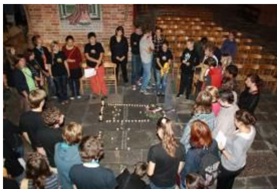
(Ringsted, Dánsko, u hrobu královny Dagmar)