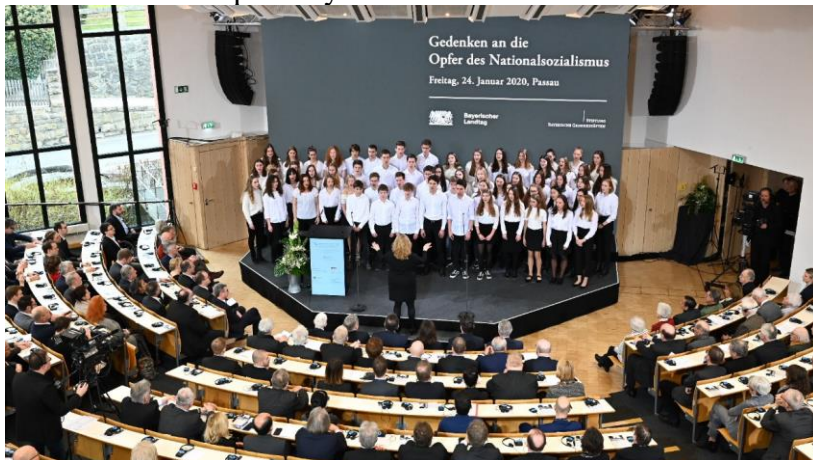
Foto: Sbor se Z a pěvecký sbor ASG-Passau

Zdroj: článek k akci na webových stránkách bavorské vlády