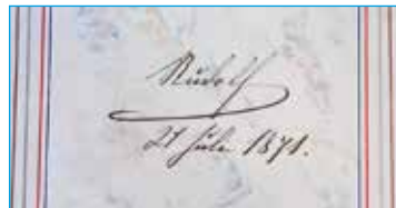
(SOkA České Budějovice)

císařovny „Sissy.“ V kronice školy se dále například dočítáme, že v roce 1885 byla při gymnáziu z části klášterní zahrady zřízena dokonce botanická zahrada .