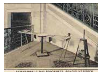
(detail z dobové pohlednice z roku 1903: Foucaultovo kyvadlo v prostoru secesního schodiště)