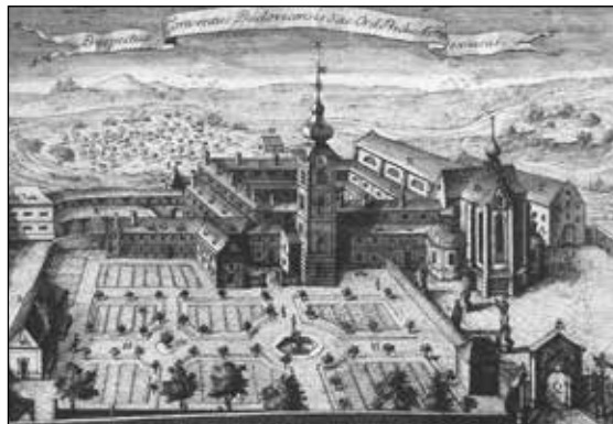
(Josef Prokyš, 1774, Jihočeské muzeum v Českých Budějovicích)