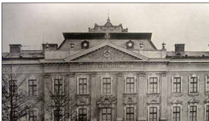
(Původně nesla fasáda německé označení školy. Archiv gymnázia)

Vedle hlavního vchodu od řeky se na stěně ve vestibulu nacházely dvě mramorové desky. Na jedné byl citát pozdně romantického lyrika Emanuela Geibela, na druhé bylo uvedeno, že toto gymnázium bylo postaveno za vlády jeho císařského Majestátu Františka Josefa I. v letech 1902 – 1903. Mramorové desky odnesl nenávratně překotný běh 20. století - byly zničeny českými studenty gymnázia po roce 1920.