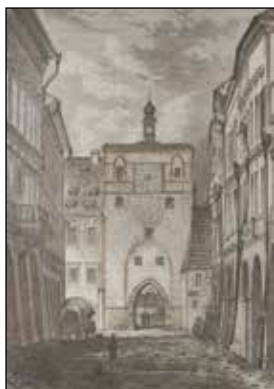
(Pražská brána v Krajinské ulici, zbořena 1867. Státní okresní archiv (dále SOKA) Č. Budějovice)

Rychle se však ukázalo, že tyto prostory jsou pro studenty nevyhovující, a tak bylo rozhodnuto vybudovat novou školu a kolej. Pro její stavbu vybrala městská rada místo staré, již nevyužívané radnice, která se nacházela v těsném sousedství současné českobudějovické radnice v dnešní Biskupské ulici.