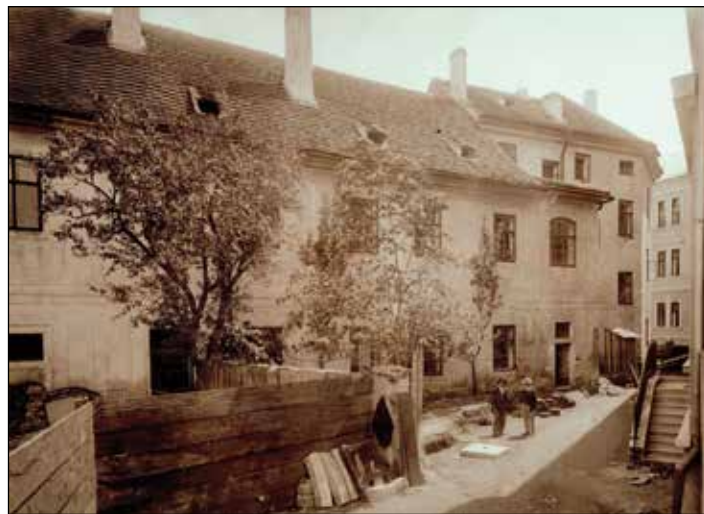
(Unikátní fotografie z letních měsíců roku 1903, kdy stály krátce obě budovy vedle sebe. Vlevo budova původního latinského gymnázia, která byla po pořízení snímku zbourána, vpravo již téměř dostavěná budova nového gymnázia.)