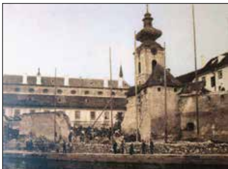
(Bourání hradeb v místě budoucího gymnázia, r. 1902,)