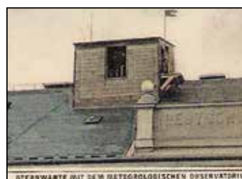
(obrázek astronomické observatoře na střeše gymnázia.)