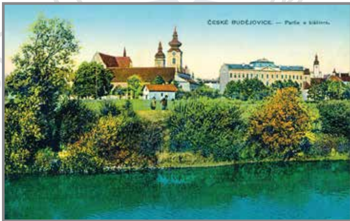
Gymnázium na dobových pohlednicích