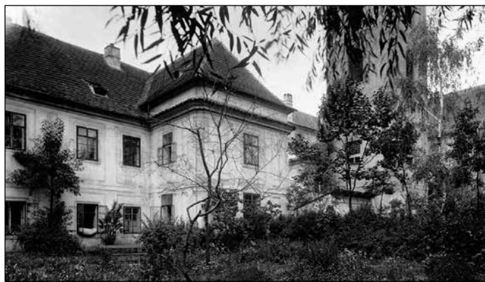
(Fotografie bývalého latinského gymnázia v areálu klášterní zahrady a současného gymnázia v České ulici.)