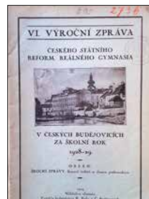
(SOKA Č. Budějovice)

Od 1. září 1923 se datuje vznik nového, tzv. pobočného reformě reálného gymnázia se sídlem v budově gymnázia v České ulici. V roce 1927 zde proběhly první maturitní zkoušky. V dobových výročních zprávách je vyjádřena spokojenost českého vedení gymnázia s vybaveností a prostorností budovy. Ve dvacátých letech minulého století se počet studentů pohyboval kolem 250, ovšem v průběhu třicátých let rychle každoročně narůstal a ve školním roce 1938 – 1939 již překonal hranici 500 studentů.