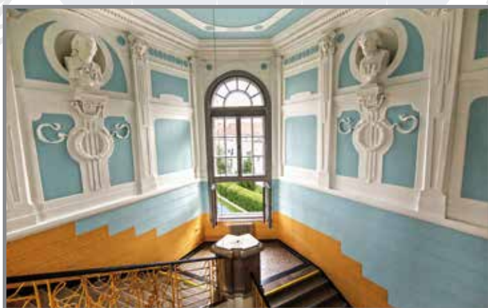
Gymnázium dnes