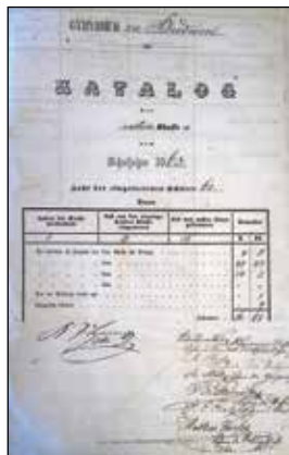
(katalog třídy I.A z r. 1863, SOkA Č. Budějovice)

V roce 1794 byly zavedeny tzv. černé a bílé knihy. Ty se nacházely v každé třídě, spolužáci do bílé knihy zapisovali dobré skutky svých kolegů a naopak, provinil - li se některý žák proti školním pravidlům, sám se musel zapsat do černé knihy. Při zkouškách museli žáci z těchto knih předčítat zápisy u svého jména. Prokázal - li žák dobrý skutek, který byl zapsán do bílé knihy, byl mu případný zápis z černé knihy vymazán. Na konci každého měsíce byly zápisy v obou knihách profesory vyhodnocovány a učiněn z nich pečlivý protokolární soupis. Jaké zápisy bychom četli asi dnes?