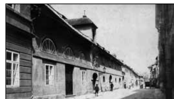
(Budova bývalé Solnice, dnes stojí v České ulici zhruba necelá polovina objektu.)

Ve 2. patře byla rovněž největší třída ve škole, která sloužila jako kreslárna a zároveň slavnostní sál u příležitosti významných událostí nebo připomenutí tradic a slavností gymnázia. Nesmíme rovněž opomenout byt pana ředitele, který si zařídil v přízemí s okny do České ulice.