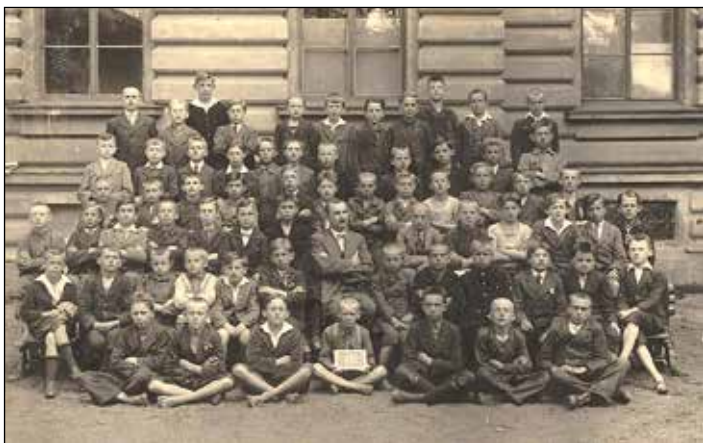
(30. léta 20. století. Archiv gymnázia)