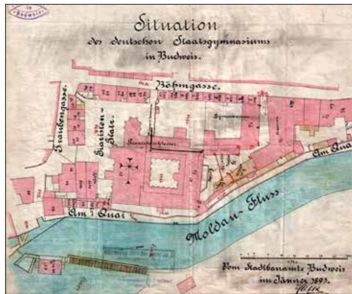
(plán z r. 1891, archiv gymnázia. Všimněme si zapomenutého pomístního názvu „Am Quai“, který s odsunem německého obyvatelstva po r. 1946 úplně vymizel)

„ Dnes končí zápis školou povinných dětek do obecných a měšťanských škol. Jako zbujnělí otrokáři, pro které neplatí ani zákon světský ani božský, vrhli se budějovičtí Němci se zuřivostí na lov českých dětí, aby slovanskou krví obrodili a novou mízou vzpružili zvětšely brak zdejšího zbankrotovaného Německví. ...I té sliny, jež se sbíhá v ústech, je škoda k ocenění takového neslýchaného biřičství!...zahřmějme do zchátralých duší podvodných německých plantážníků: „Vyzvali jste nás k boji na život a na smrt. Dobrá, p ř i j í m á m e j e j a p r o v e d e m e j e j !“ (Budivoj, roč. XXXIX, 15. září 1903, č. 76).